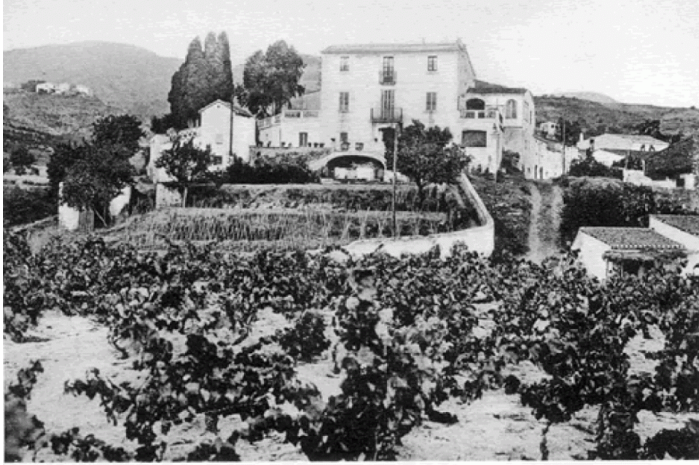
1920. Ca n'Icu.