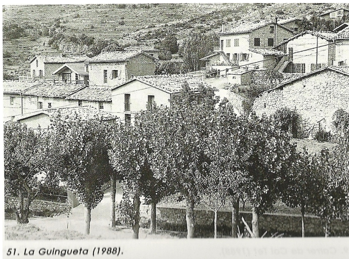
51. La Guingueta (1988).