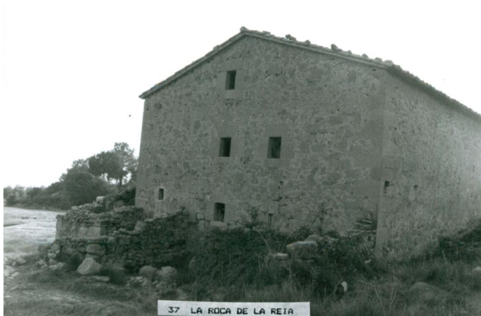
37 LA ROCA DE LA REIA