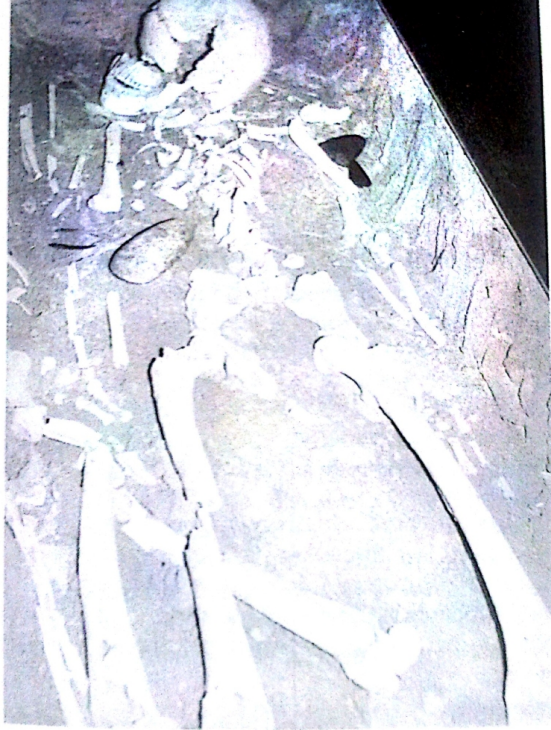
Sepulcre de Fossa n.º 2 de la Bòvila de Can Vallès del Bruc - Museu del Monestí de Montserrat.