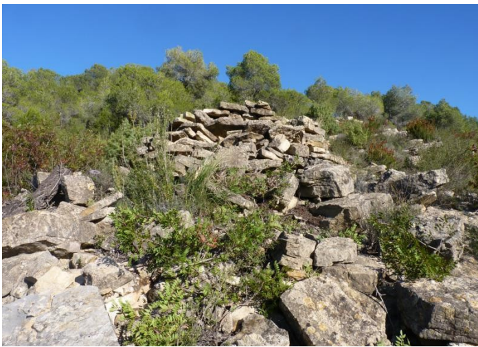
LLINDA A TERRA 90 x 9