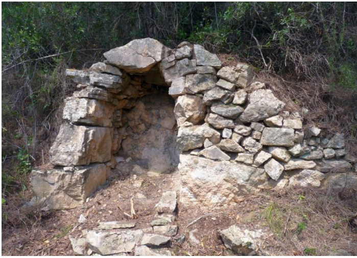
LLINDA ARC DE MIG PUNT