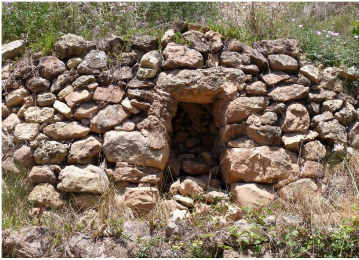
LLINDA 70 x 16