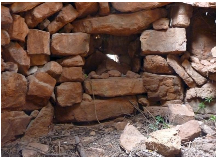
LLINDA 68 x 13