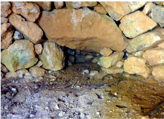
LLINDA 86 x 24