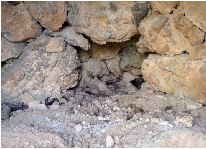
LLINDA ARC PRIMITIU