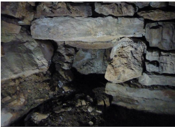
Linda 75 x 10