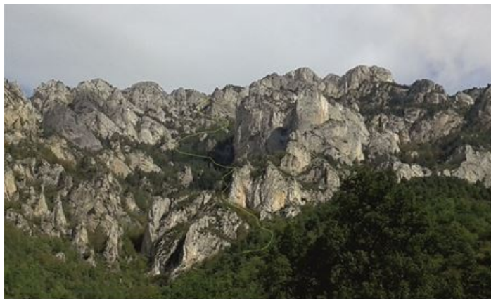
Camí de Coll de Jou per Rocasaça