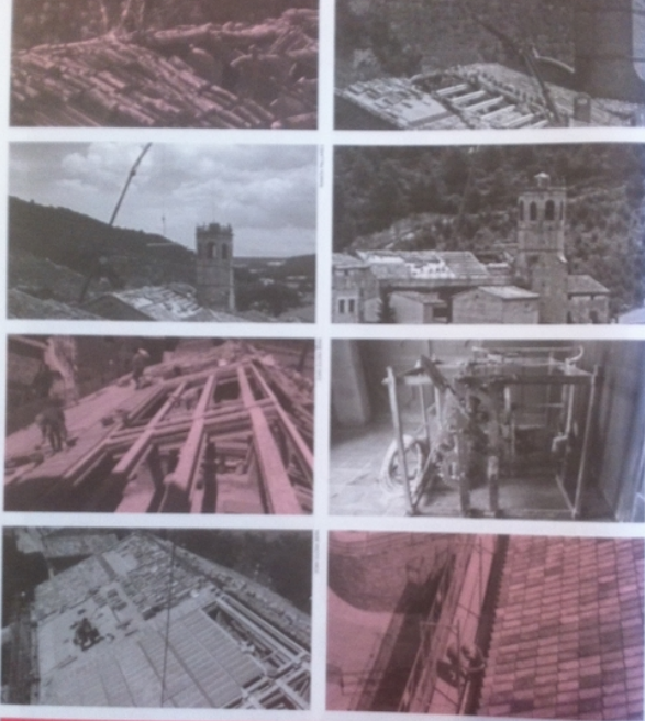
Rehabilitació de la teulada de l'església parroquial de Santa Maria de Copons. Juny - Juliol de 2013