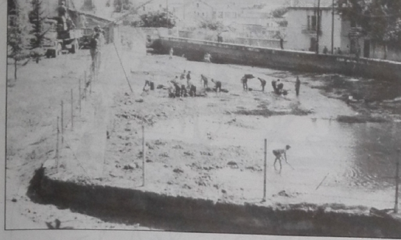
Abans la Bassa calia netejar-la cada any