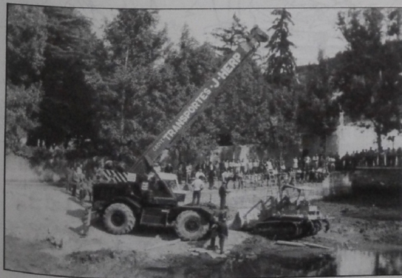
Però la màquina quedà atrapada i calgué treure-la amb grua

Revista La Miranda . juny 1991. Neteia de la Bassa