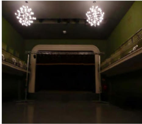
Detalls del Teatre de la Lliga. SPAL, 2010. Vol 3.1: 140-2)