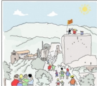
El diumenge 5 de setembre al Castell anem arribant i fem una festa grossa com la dels aplescs d'abans