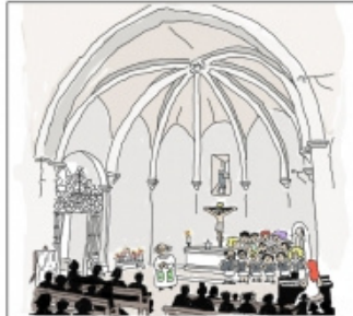
A la una Missa Solemne i de la Coral la cantada amb els Goigs i la llegenda de la imatge trobada