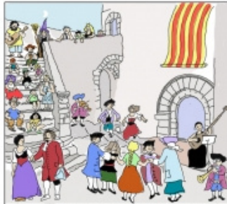
A les cinc de la tarda Xuriach i la Betiana ens duen música i dansa per arcedonir la diada