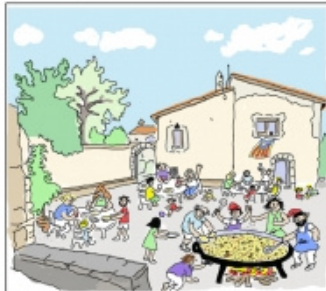
A quasi de tres tot a punt per al dinar de germanes que enguany és l'arrossada per recuperar la tradició