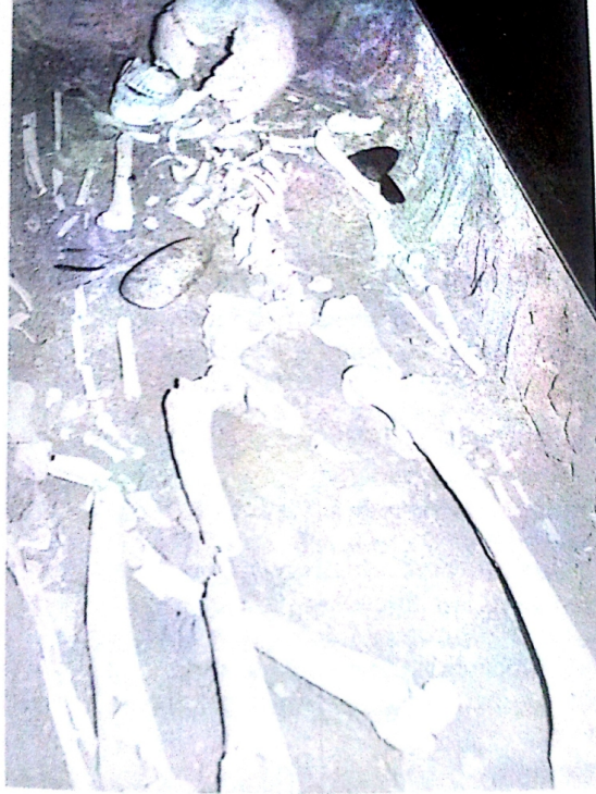
Sepulcre de Fossa n.º 2 de la Bòvila de Can Vallès del Bruc - Museu del Monestí de Montserrat.