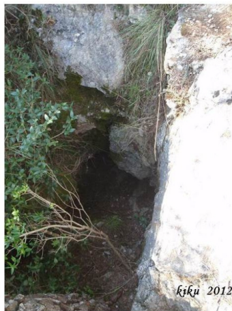
AVENC DEL TRIO Vallirana - Baix Llobregat Topografia: Jordi Esteve (*) EIE - PCB 21 desembre 1989